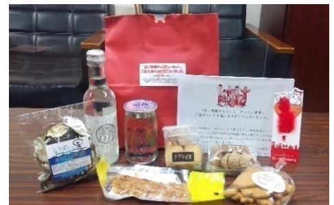
昨年度のチャリティーセット

今年も豪華賞品が当たる抽選券付きとなっておりますので、皆様方のご協力をよろしくお願い致します。