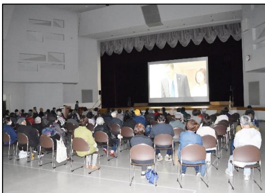
▲10.21 阿寒町公民館上映の様子