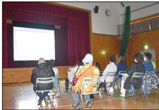
▲10.22 阿寒湖まりむ館上映の様子