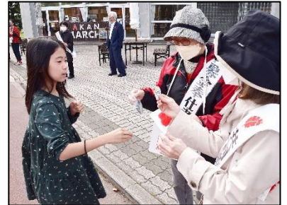
(街頭募金の様子・左からボーイスカウト・商業高等学校・道の駅阿寒丹頂の里前〔阿寒地区〕にて)

10月1日(日)より今年で77回目となる赤い羽根共同募金運動がスタートしました。