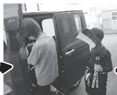
提供会員さんが大きな荷物を積み込んでくれましたよ