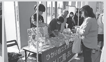
《サウンドテーブルテニスの体験会》 《車いすバスケットボールの体験会》 《パラスポ競技用具展示の様子》 《まごころマーケットの様子》