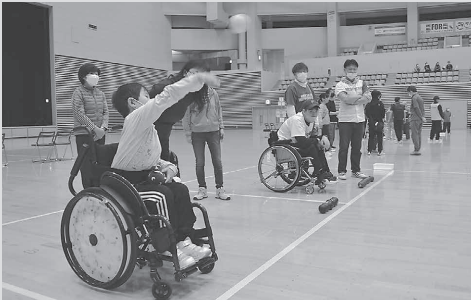
《ボッチャ競技の様子》