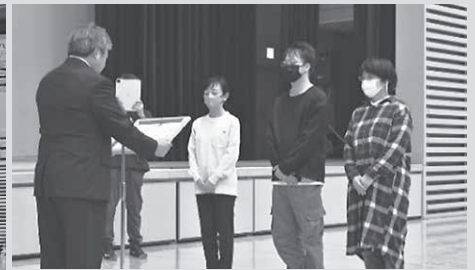
《ボッチャ競技表彰・優勝》