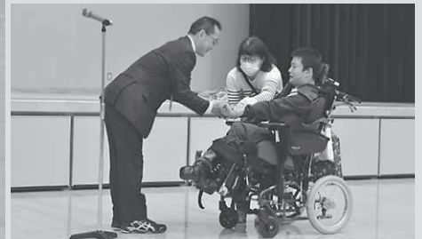
《くしろパラスポ賞受賞》

第2回くしろパラスポフェスタが11月12日(日)、ウインドヒルクしろスーパーアリーナで開催されました。このフェスタは、障がいのある人もない人もパラスポーツ等を通じて交流し障がいへの理解を深めることを目的としています。