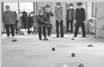
ボッチャでワイワイ！