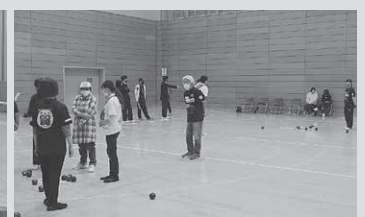
《パラスポパネル展示の様子》 《フライングディスクの体験会》 《車いすスラロームの体験会》 《ボッチャの体験会》